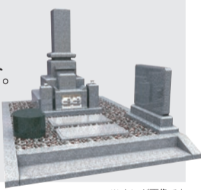
※イメージ画像です。